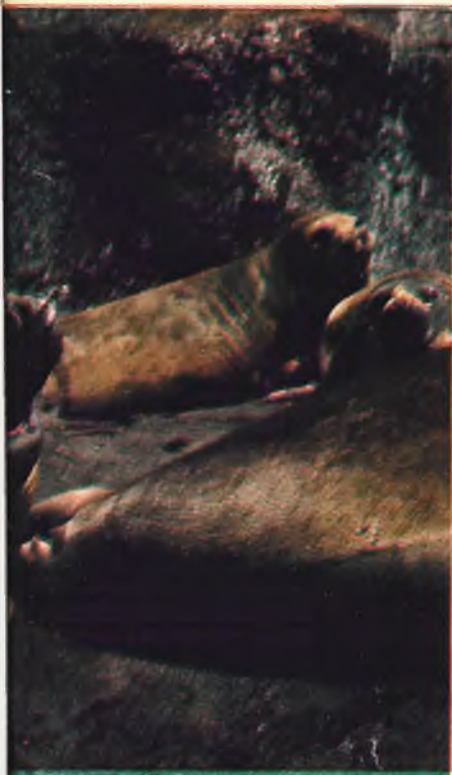
...mos sonidos en tierra, que probablemente sonidos submarinos de la foca barbuda, estudiados en Nueva York.