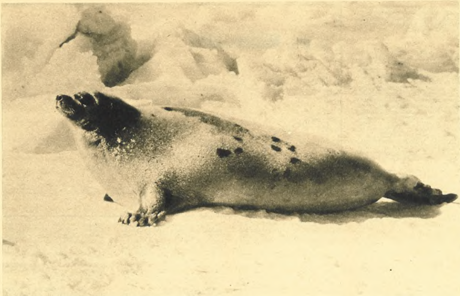
Foca groenlandica (« Pagophilus groenlandicus »), llamada también foca pía, que vive en grandes bandadas de hasta siete mil individuos.

la caza de las focas que se encuentran dormidas en el hielo, como, sobre todo, para las que emergen imprevisiblemente por los agujeros, estos hombres han de permanecer inmóviles y expuestos al frío durante horas. Una cosa es cierta, los esquimales sólo matan el número de focas que estrictamente necesitan, con lo que la especie no corre nunca peligro; es, pues, una de las más abundantes.