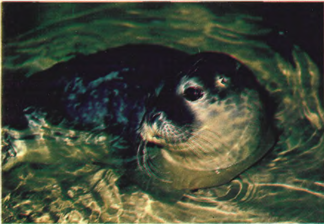
La foca común («Phoca vitulina») vive en las regiones árticas del Atlántico y del Pacífico. En algunos inviernos muy crudos se han visto algunos ejemplares en el Cantábrico. Constituye el principal alimento de los esquimales.