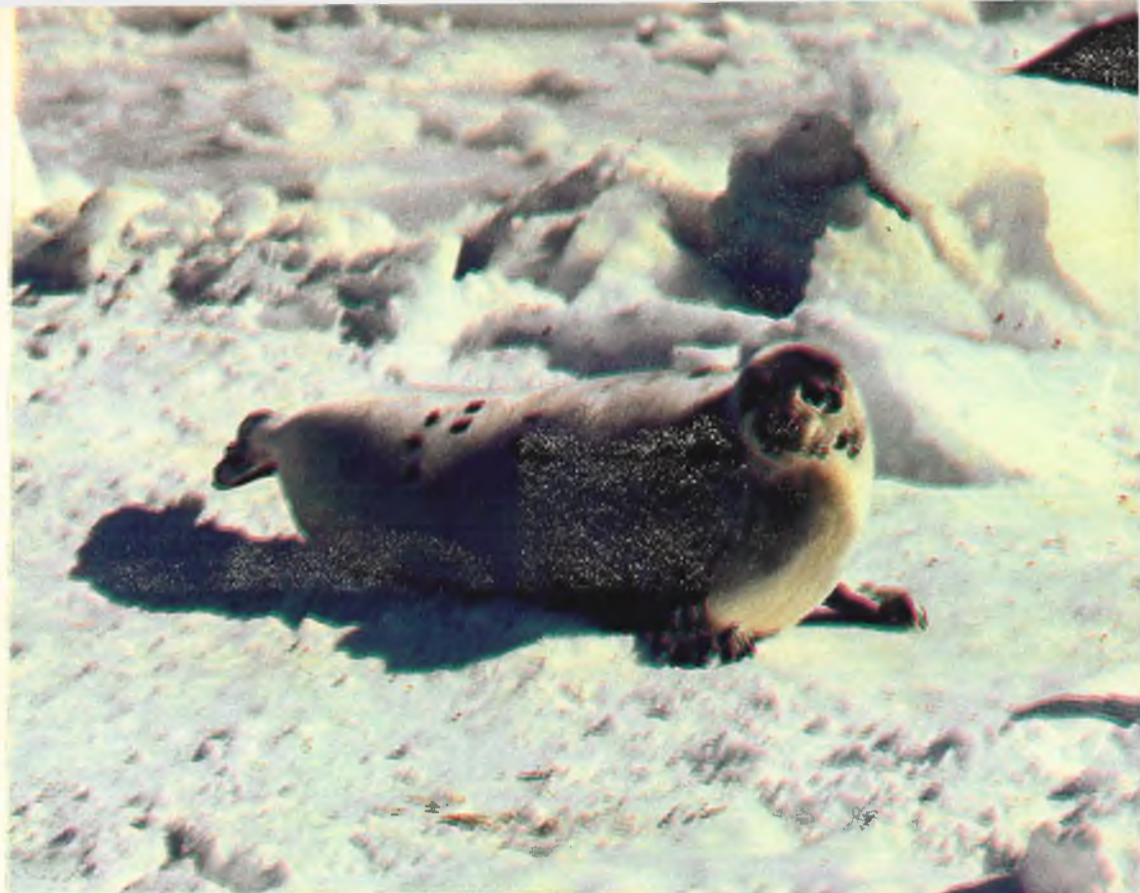
La foca groenlandica o foca pia («Pagophilus groenlandicus») es considerada como la mejor nadadora de todos los fócidos. Se encuentran en el mar Blanco (al norte de Rusia), en la isla de Jan Mayen (junto a Groenlandia) y en aguas orientales y occidentales de Terranova.