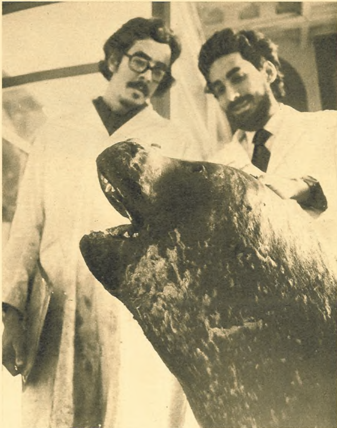
Un primer plano de la foca común, del Mediterráneo.

útiles a los esquimales, de ella obtiene la carne que constituye su principal alimento; la grasa que, derretida, utilizan como bebida y combustible; y, por último, la piel, con la que fabrican botas, correas, trajes y redes; con ella también forran sus embarcaciones y construyen sus «topeks» o viviendas de verano.