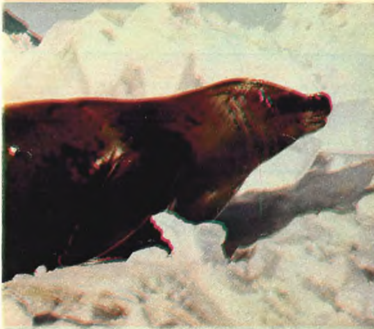
Combate de elefantes marinos en la isla Kerguelen (llamada también de la Desolación), al sur del océano Indico.

deducir cuál ha sido el camino que han seguido a través de la evolución. Según los estudios clásicos se cree que todos los pinnípedos, en general, tuvieron