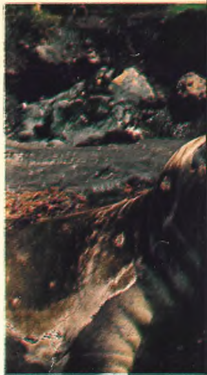
El elefante marino («Mirounga leonina») guarda relación con los elefantes terrestres. Recientemente por la Sociedad Zoológica de Madrid se ha conseguido un ejemplar en cautividad.